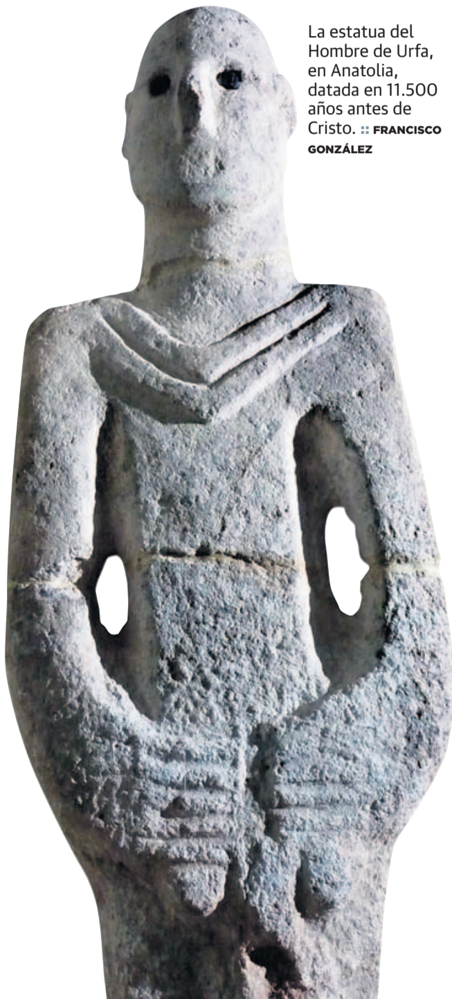
La estatua del Hombre de Urfa, en Anatolia, datada en 11.500 años antes de Cristo. :: FRANCISCO GONZÁLEZ

Así que González ha querido reunir en este libro una docena de capítulos donde recorre civilizaciones desde Babilonia, Sumeria o Egipto hasta Nazca, Indonesia, Japón o los anasazi en Norteamérica. Y agrupa analogías arquitectónicas en principio más que improbables, por no repetir el título del libro. «Mis fuentes son científicos, arqueólogos de mucho prestigio, y también investigadores reputados de fenómenos como el megalitismo. Aunque estos últimos suelen ser rechazados por esa visión restringida de la arqueología convencional». El alavés admite que «doy unos saltos un poco grandes, en contraste con el arqueólogo de carrera, ortodoxo. Me gusta el pensamiento 'fuera de la caja', de tomar distancia, y ver el planeta como si fuera una región, una cosa pequeña.